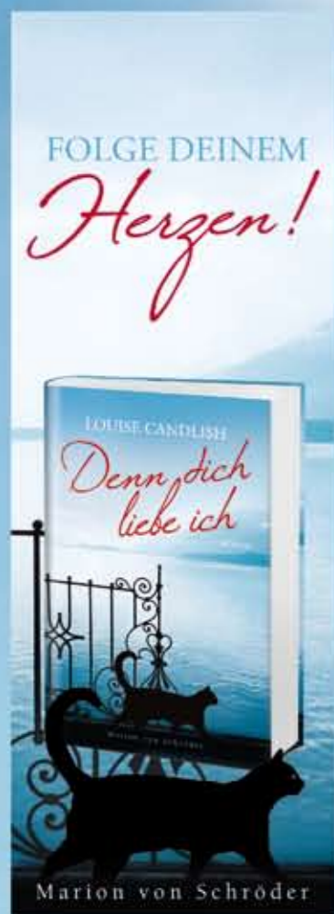
Streifenplakat 30 x 84 cm

Als ihre Mutter stirbt, kehren bei Olivia mit aller Macht die Erinnerungen zurück: An eine unglückliche Kindheit, an eine verbotene Liebe. Olivia macht sich auf, den Mann zu finden, den sie nicht vergessen kann. In einem malerischen Ort an der englischen Südküste begegnet sie ihm wieder. Es ist wie damals. Fast.